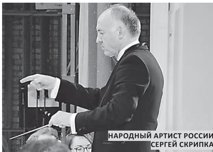
НАРОДНЫЙ АРТИСТ РОССИИ СЕРГЕЙ СКРИПКА